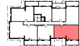
PLAN DE REPERAGE, ech. 1/1000