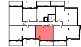
PLAN DE REPERAGE, ech. 1/1000