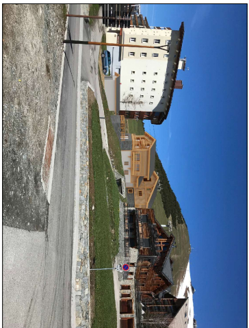
Plan LOT 03