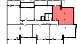
PLAN DE REPERAGE, ech. 1/1000